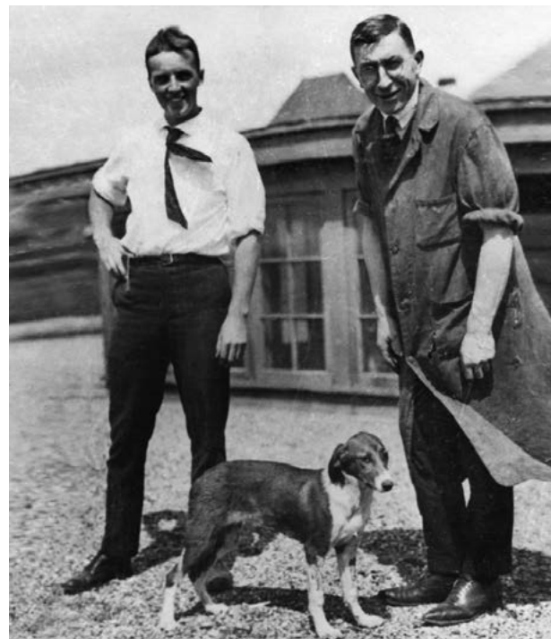
Charles Best e Frederick Banting insieme a uno dei cani grazie al cui sacrificio è stato possibile isolare l'insulina.

L'insulina che i diabetici assumono oggi è un'ulteriore portento della ricerca: prodotta non più in un'industria chimica, ma in una microfabbrica biologica, ossia un batterio o un lievito in cui è stato inserito il gene dell'insulina umana. Il merito è degli scienziati della Genentech, la prima azienda biotec-