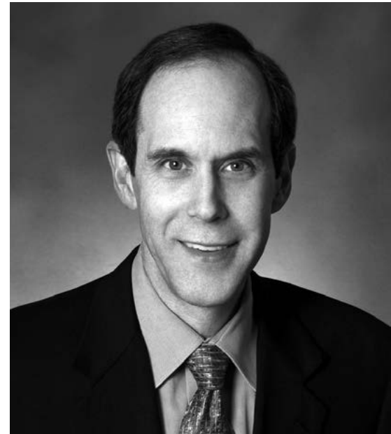
Brian J. Druker, il papà dell'imatinib, il primo farmaco che blocca uno specifico bersaglio tumorale.

Ancora oggi sono molto più numerose le medicine con una storia che ricorda quella dell'aspirina piuttosto che quelle che ricordano il glivec. Sono medicine nate dalla selezione fra le tante molecole presenti in natura che poi abbiamo riprodotto e modificato in un laboratorio chimico; sono state provate contro diverse malattie e quando abbiamo visto